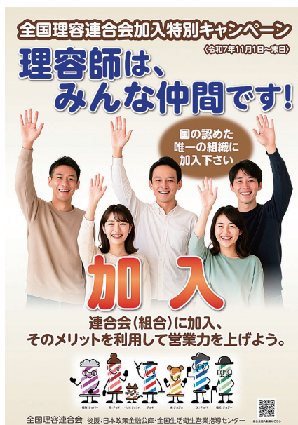
キャンペーンポスター

(2)ポスターを全国各支部へ支部員数 を送付し、また各組合へは保健 所、指導センター、日本公庫支店 等への掲示依頼等に活用するため