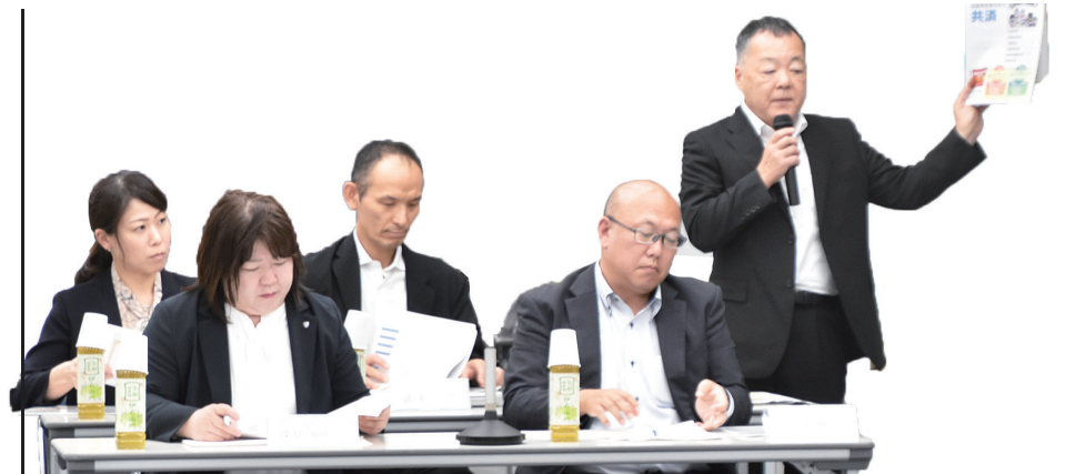
説明する第一生命担当者