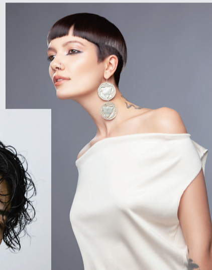
SDGsヘア2024 優秀スタイル