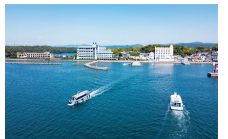
離島ならではの特別感が味わえる