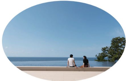
大海原を臨むインフィニティ足湯

カップルやファミリー・グループまで全てのゲストが集う場所、SHIRAHAMA KEY TERRACE HOTEL SEAMOREは、日本三古湯の一つとして知られる白浜温泉に位置し、目の前に広がる太平洋の潮風と波の音に包まれる海辺の大型リゾート施設。訪れたらまず利用したいのがホテル自慢のインフィニティ足湯。眼下に広がる海と一体化するように設計されて