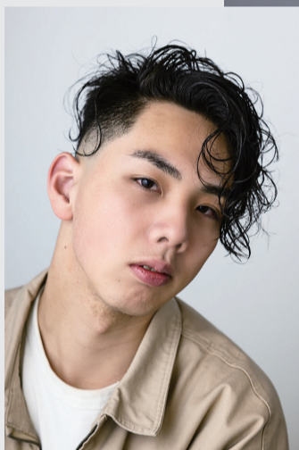
SDGsヘア2024 最優秀スタイル