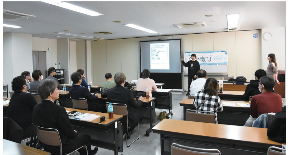
「デジ活！儲かる塾」セミナーの様子。各支部から2名の委員が出席して行われた

令和6年度、全国理容連合会では儲かる業づくりにむけて、国の補助金を活用した、「ヘアサロンの売れるメニューづくり(儲かる業づくり)セミナー」(令和5年度生活衛生関係営業対策事業(補正予算))と「デジ活！儲かる塾」(令和6年度生活衛生関係営業対策事業)に取り組んでおり、昨年10月21日には愛媛県松山市で開催されたヘアワールド・ジャパンカップ2024会場内の特設ブースで、全国理容総合研究所により、単価