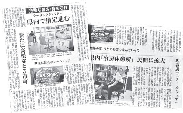
クールシェアを取り上げた各紙

わせ2007年から主にクールビズヘアとして取り組んでいる地球温暖化防止対策。2019年には脱プラを呼びか